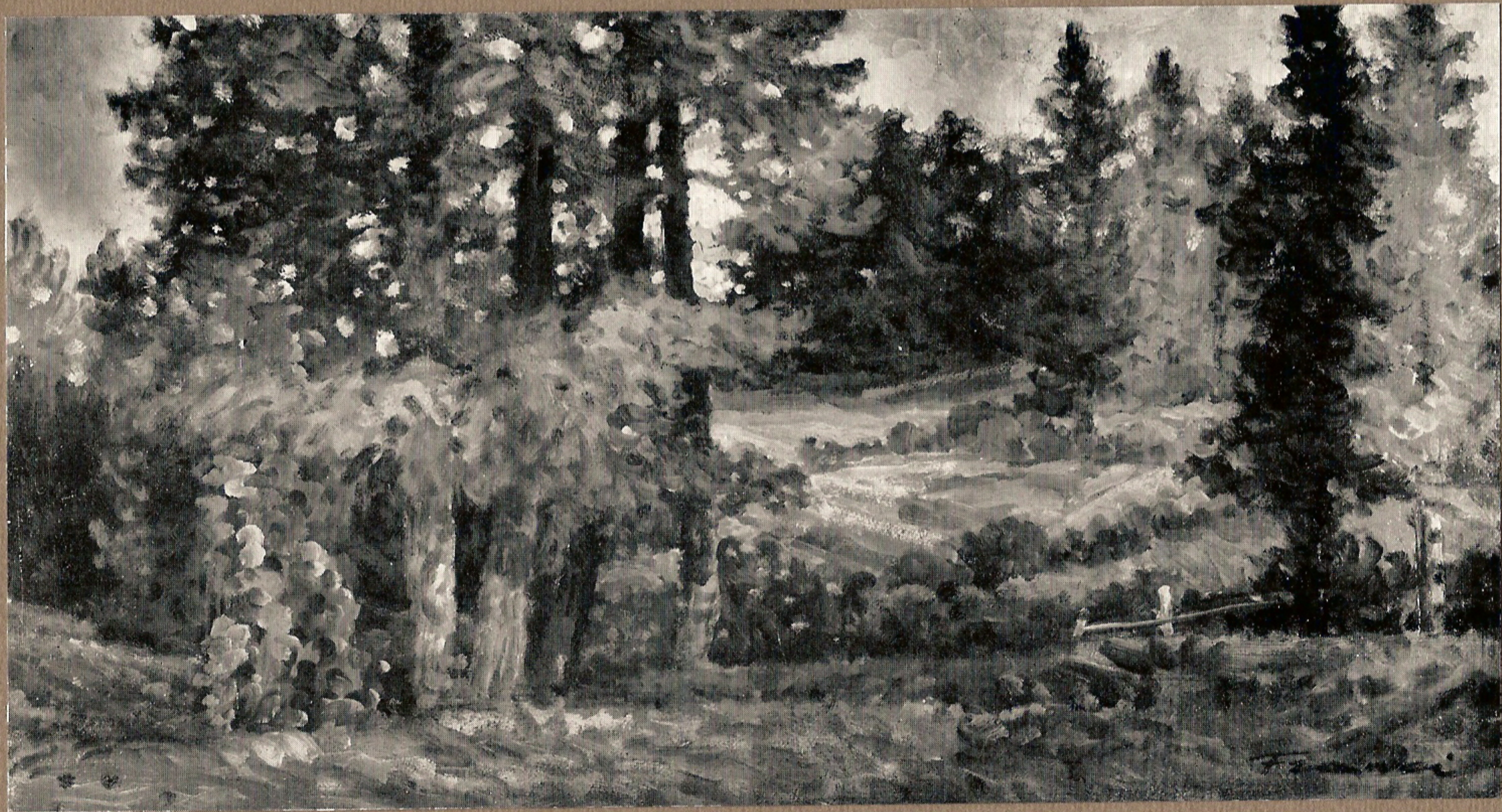
Radura nel bosco